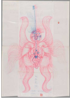
GUO Fengyi (1942–2010) „Image of the Ninth Hexagram“, 1990 Filzstift auf Japanpapier