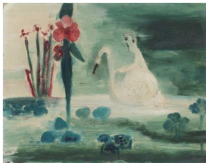
Else Blankenhorn, (1873–1920) Ohne Titel, vor 1919 Öl auf Leinwand