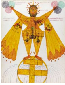
Janko Domsic (1915–1983) Ohne Tite, um 1970 Kugelschreiber und Filzstift auf Karton © Sammlung Dammann