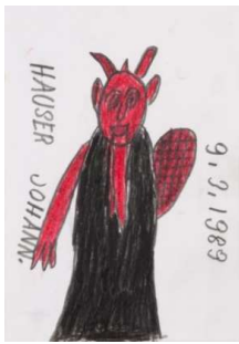
Johann Hauser (1926–1996) Ohne Titel (Krampus), 1989 Bleistift und Farbstift auf Papier