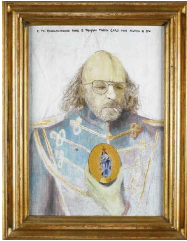
Anton Bernhardsgrütter (Anton B. Ipc, geb. 1925) “E poi bisognerebbe dire è troppo tardi caro mio Anton B. Ipc”, 1979 Acryl auf Leinwand, 46,5 × 34 cm © Museum im Lagerhaus, Stiftung für schweizerische Naive Kunst und Art Brut