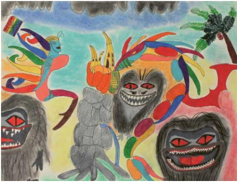
Francesca Bertolosi (*1977) Fruchtgummi-Land (Elfe mit schwarzen «Mistviechern»), 2019, Pastellkreide, Farbstift, Filzstift auf Papier Fruit gum country (Elf with black 'dung bugs') , 2019, chalk pastels, coloured pencil, felt-tip pen on paper 40 x 50 cm © 2019 Kreativwerkstatt Bürgerspital Basel