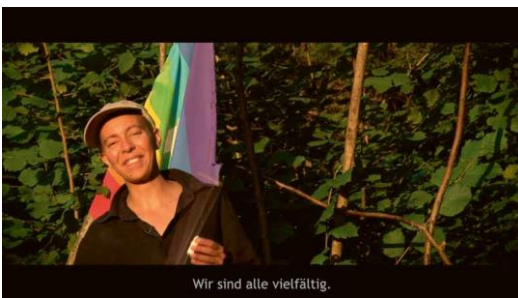
Michelle <Jazzie> Biolley (*1976) Genderwonderland, 2016, Regie, Kamera, Schnitt, Filmstill < Aude> Genderwonderland, 2016, direction, camera, cut, film still < Aude>