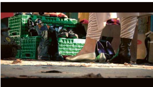
Michelle <Jazzie> Biolley (*1976) Genderwonderland, 2016, Regie, Kamera, Schnitt, Filmstill < Berlin> Genderwonderland, 2016, direction, camera, cut, film still < Berlin> © 2019 Michelle <Jazzie> Biolley