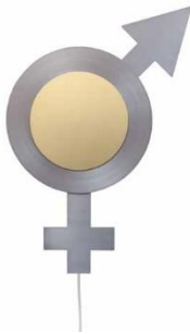
Sascha Alexa Martin Müller (*1964) Genderpendel, Mechanisches Wandobjekt, 2017 (Autobiografische Mechanik), Stahl- und Messingblech, Stahlteile, Motor mit Bewegungssensor Gender pendulum, mechanical wall object, 2017 (autobiographical mechanics), sheet steel and sheet brass, steel parts, motor with motion sensor ø 80 cm, Tiefe 18 cm © 2019 Sascha Alexa Martin Müller