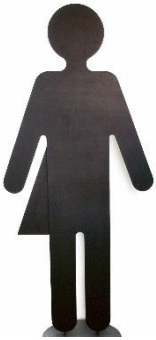
Sascha Alexa Martin Müller (*1964) Genderfluid, Mechanische Skulptur, 2018, MDF, schwarz geölt, Stahlteile, Sockel: Stahlblech, farblos lackiert, Motor mit Bewegungssensor Genderfluid, mechanical sculpture, 2018, MDF, oiled in black, steel parts, base: sheet steel, transparent lacquer, motor with motion sensor 190 x 86 cm, ø 48 cm © 2019 Sascha Alexa Martin Müller