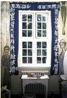
Ovartaci's Zimmer mit Arbeitstisch und Banner mit chinesischer Schrift, Fotografie Ovartaci's room with worktable and Chinese banners, photography