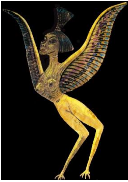
Ovartaci (1894-1985) Ohne Titel, (weiblicher Vogel), ausgeschnitten, Gouache Untitled (female bird), cut out, gouache 40 x 30 cm