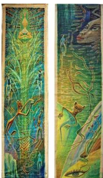
Overtaci (1894-1985) Ohne Titel, Gouache Untitled, gouache 350 x 50 cm